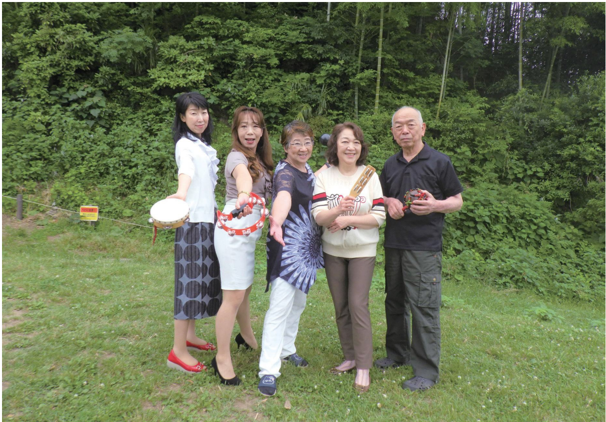
(「ミュージックフェスティバル実行委員会」の皆さん)