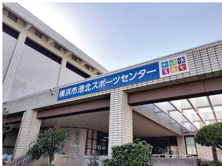
▲ 港北スポーツセンター

住 所: 横浜市港北区大豆戸町518-1 電 話: 045-544-2636 FAX: 045-544-1859 開館時間: 7時30分～21時 (開館7時20分・受付20時終了) 休 館 日: 毎月第3月曜日(祝日の場合は翌日) 年末年始、その他館が定めた日 交 通: JR・市営地下鉄「新横浜」駅より徒歩15分 JR・東急東横線「菊名」駅より徒歩15分 東急東横線「大倉山」駅より徒歩15分