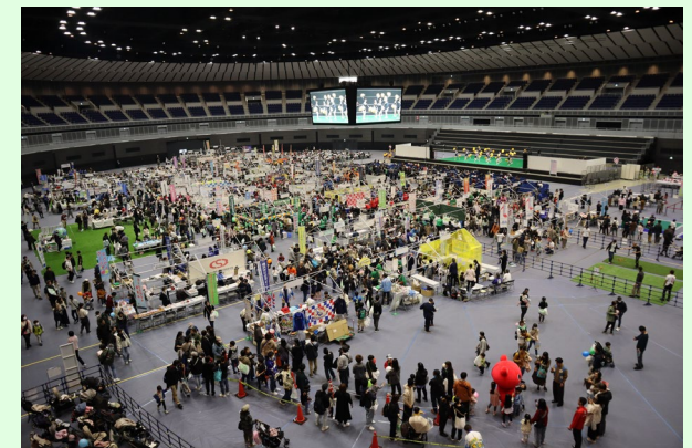
ふるさと港北ふれあいまつり