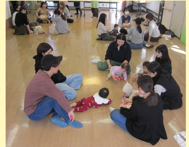
「赤ちゃん会」の様子