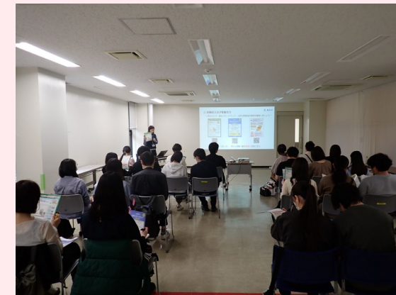
妊産婦・子育て世代を対象とした防災講話

道路・下水道・公園等の適切な維持管理の実施、感染予防の啓発や感染症への迅速かつ適切な対応、食の安全や施設の衛生確保、動物の適正飼育啓発