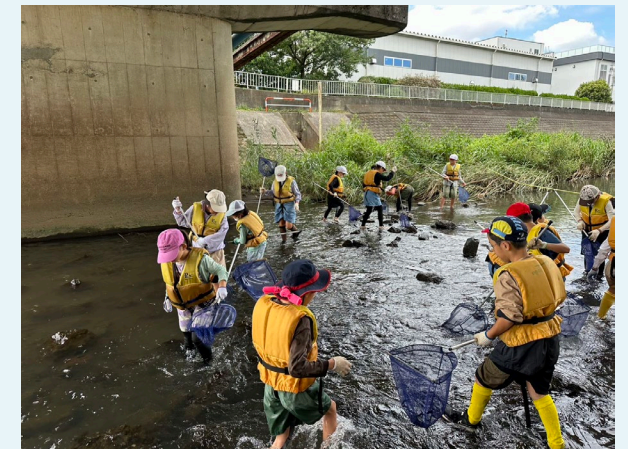
自然環境の体験型講座