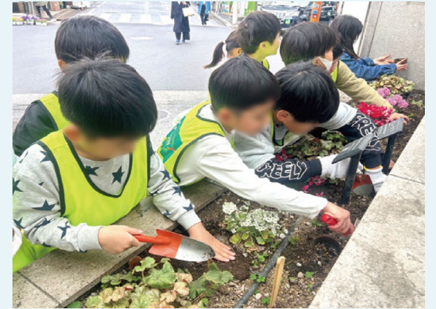
地域の花壇への定植

環境活動や防災活動が地域に根付くことを目指し、区内小学生向けに鶴見川流域の自然環境と防災等について学習する体験型講座を実施