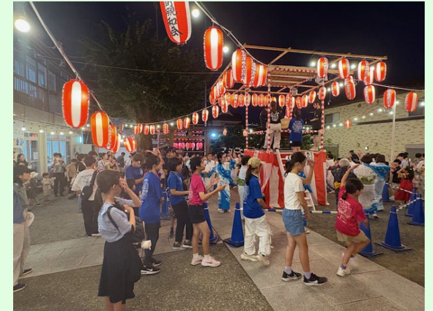
自治会町内会の活動

日吉図書取次所「日吉の本だな」等を活用した地域交流・読書活動の推進や芸術文化の振興、地域活動の担い手を育成する「港北地域学」講座