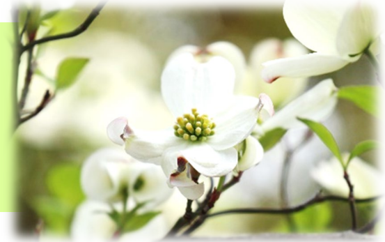
区の木：ハナミズキ

人も企業もつながり まちが賑わい、暮らしやすさとともに 自然・文化・歴史に包まれ、誰もが安心して希望にみちた日々を過ごす… そんな「 住みたい・住み続けたい豊かさ があふれるまち」を目指し、取組を進めます。