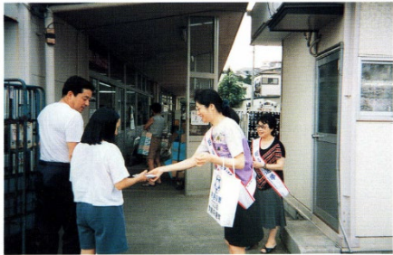
スーパーの前での啓発（港北区）

1995(平成7)年参院選の街頭啓発風景