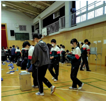
真剣に考えて投票する生徒たち

Aさん「自分が納得する人に投票して、自分の意見を政治に 反映させることの重要性を学んだ。みんなが住みたい、 住みやすい横浜になってほしい」 Bさん「一票の大切さを知り、有権者になったら実際に投票に 行こうと思った」