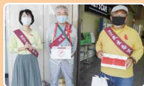
赤い羽根共同募金の街頭募金活動