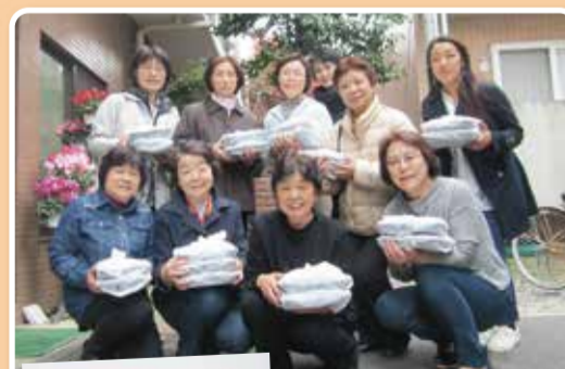
高齢者へ弁当を配達