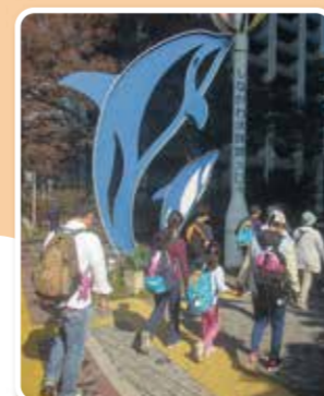
障害児の余暇支援