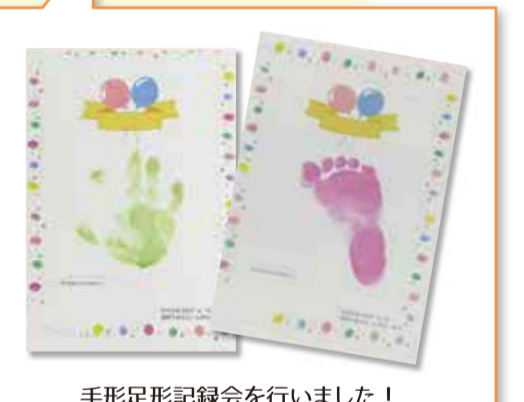
手形足形記録会を行いました！