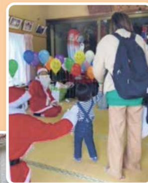
クリスマス会等の季節行事