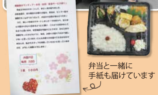
弁当と一緒に手紙も届けています