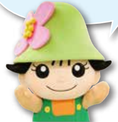
港北区ミスキー 港北区のキャラクター ハナミスキーの妖精