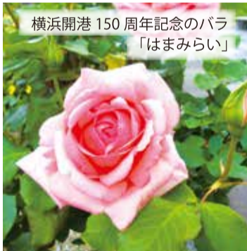
横浜開港150周年記念のバラ「はまみらい」

横浜市は、東京2020オリンピック・パラリンピックにおける英国代表チームの事前キャンプ地になっており、港北区にも英国代表チームがやって来ます。GOG2020 検索 今年の港北オープンガーデンには、英国で生まれた人気キャラクター「ひつじのショーン」が、横浜と英国をつなぐ親善大使として登場します。新企画のスタンプラリー*や、ひつじのショーン・ミズキーとのグリーティングも実施します。会場でも、ショーンとミズキーを探してみましょう! ※スタンプラリーの台紙は特設案内所で配布します