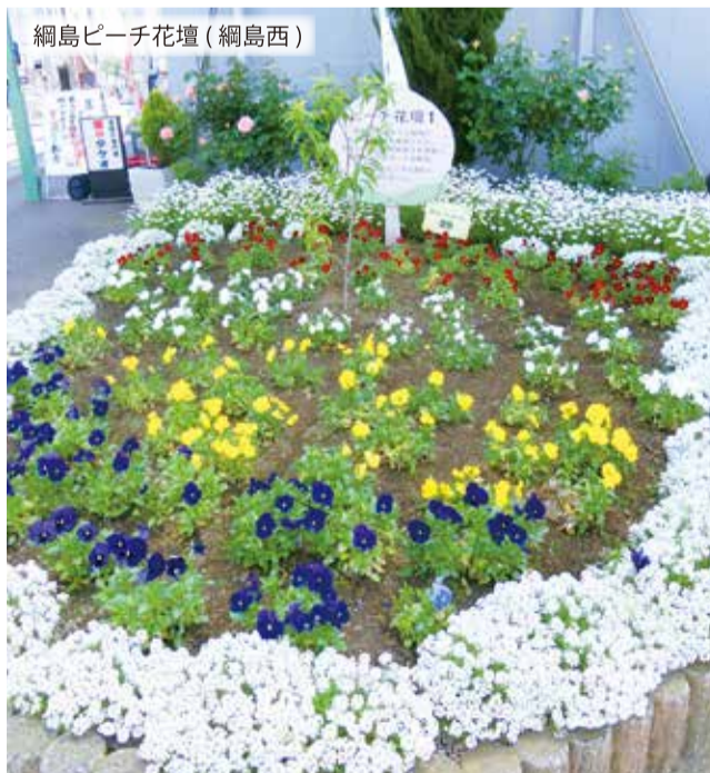
綱島ピーチ花壇(綱島西)