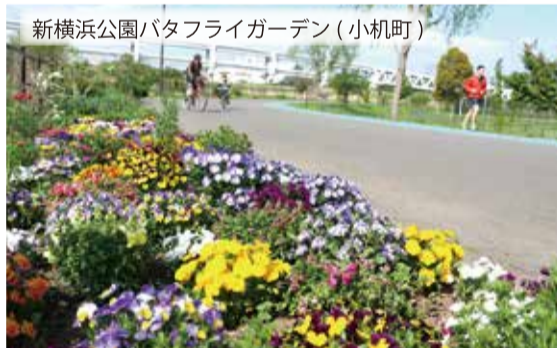
新横浜公園バタフライガーデン(小机町)