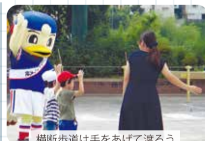
横断歩道は手を上げて渡ろう

港北区安全安心大使に任命されたマリノスケが、小学校での「はまっ子交通あんぜん教室」などを通じて区民の皆さんに交通安全を呼び掛けています。