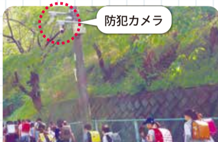
通学路に設置された防犯カメラ(岸根町町内会)

積極的な防犯カメラの設置により地域の安全を確保し、安心して暮らせるまちづくりを推進しています。区内では、この3年間で50台以上の防犯カメラが設置されています。