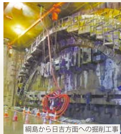
綱島から日吉方面への掘削工事