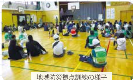
地域防災拠点訓練の様子

災害発生時に開設される「地域防災拠点」では、自治会町内会など地域の皆さんを中心とした運営委員会が、拠点の運営を行います。平時には、訓練や防災備蓄品などの管理をしています。