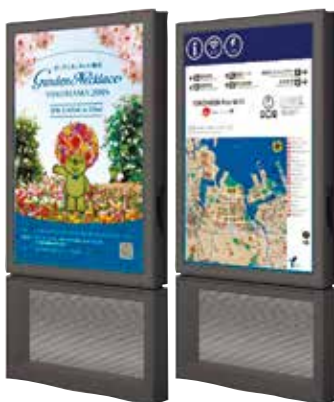
広告付案内サインのイメージ

広告付案内サインと無料Wi-Fiの整備を進めます。競技場周辺道路にある標識の多言語対応や歩道の段差解消、視覚障害者誘導用ブロックなど、バリアフリー設備の修繕を進めます。大会開催に合わせて、小机駅周辺でにぎわい創出イベントを開催します。飲食を楽しみ、地場野菜に触れる機会をつくり、来街者のおもてなしや港北区のPRにつなげます。