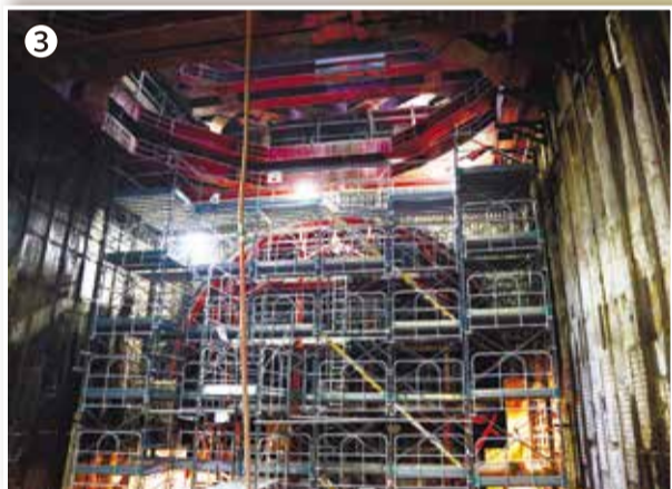
奥にトンネルの形が見える

新横浜駅(仮称)周辺工事では、環状2号線の真下で駅舎建設を進めています(写真④)。交通量が多いため、幹線道路としての機能を維持して工事を進める必要があります。掘削範囲を少なくするために、本来仮設で造る壁を、地下駅舎本体に利用できる鋼製地中連続壁にしています(写真⑤)。さらに、地中にある水道管や電気ケーブルなどを別の場所に動かすなど難しい作業を進めています。現在、路面覆工板(地下の大空間を覆うふた)の下は地下4階までの大空間となっています(写真⑥)。覆工板上を大量の車が通行するため、毎日点検をして安全確認をしています。