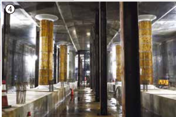
地下4階に新横浜駅(仮称)のホームができるところ