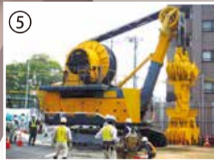
鋼製地中連続壁を造るのに使われた、日本に4台しかない特殊な重機(CSM機)