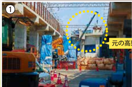
東急線の線路を外側に切り替えた後、元の高架橋を撤去している様子