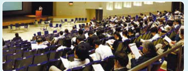
在宅チーム医療を担う人材育成研修会