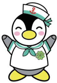
横浜市版 民生委員・児童委員キャラクター「よこはまミンジー」

民生委員・児童委員は、地域の皆さんからの相談に応じ、区役所やケアプラザ等の関係機関との「つなぎ役」を担っています。厚生労働大臣から委嘱される非常勤特別職の地方公務員で、区内では約370人が活動しています。