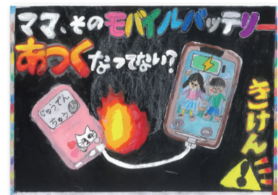
昨年の最優秀作品(港北火災予防協会会長賞)