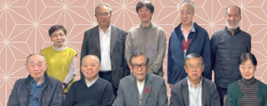
港北区商店街連合会の皆さん