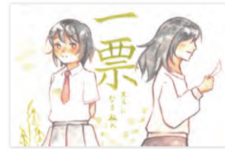
入賞作品(高校生の部)