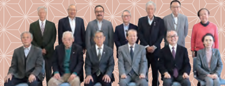
港北区連合町内会の皆さん

より魅力あるプレーをお見せできるよう精進します。今年も熱い応援をよろしくお願いいたします。