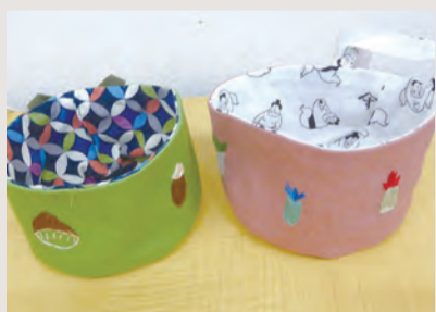
イチオシの刺しゅう ※一点物です。