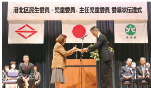
委嘱状伝達式の様子

2025年12月1日に港北区民生委員・児童委員、主任児童委員368人の委嘱状伝達式を行いました。