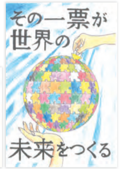
入賞作品(中学生の部)