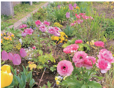
コミュニティ花壇