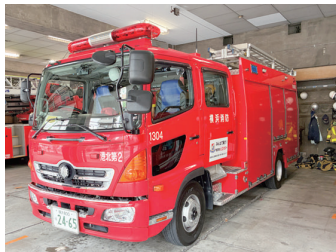
消防車両の展示の様子