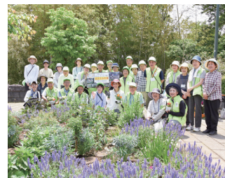
講習の様子(大倉山公園)