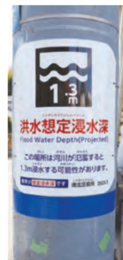
▲まるとまごごとハザードマップ