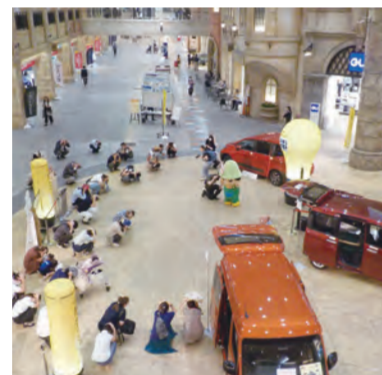
▲「港北シェイクアウト！」