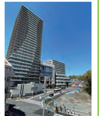
再開発が進む綱島エリア▶