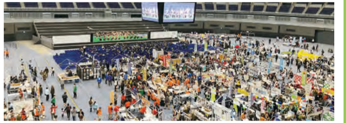
多くの人で賑わ会場▶

世代や地域を超えた区民の交流の場として、横浜アリーナを会場に「ふるさと港北ふれあいまつり」を開催します。(11月)