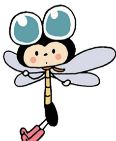
港北図書館キャラクター カブク・てんてん・しよんぼ