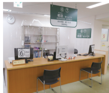
座って司書に相談できます。