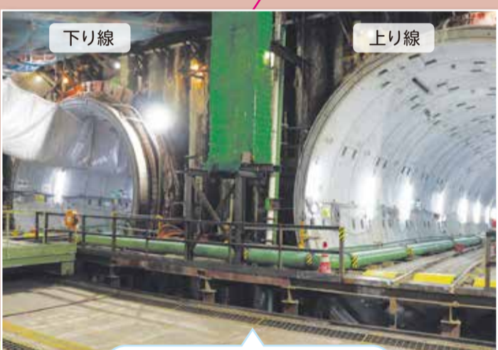
シールドマシンの折り返し地点