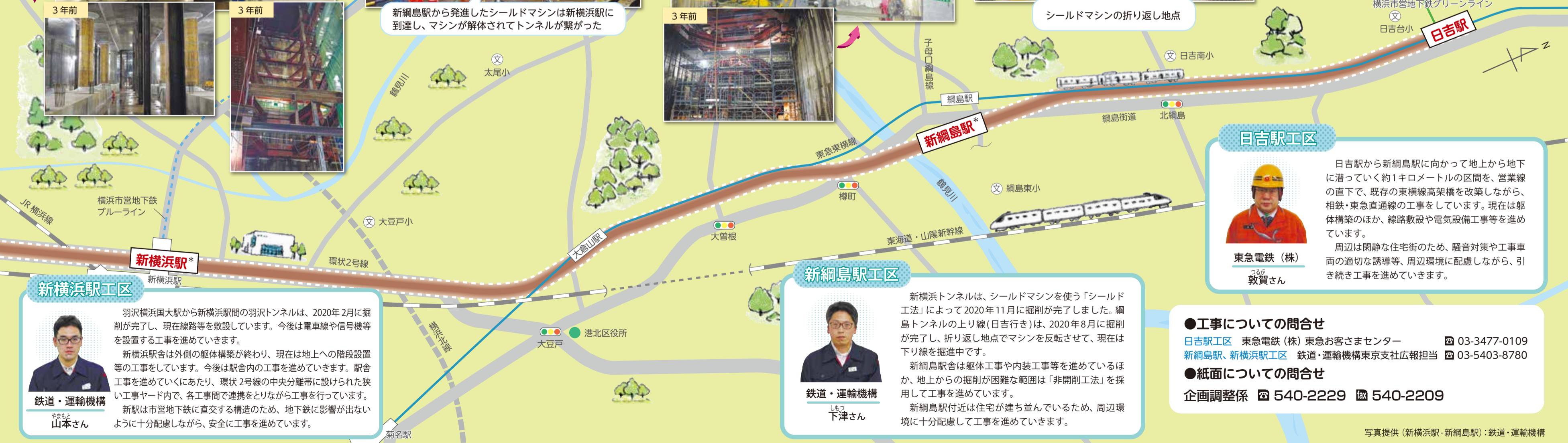
地下躯体が完成し、既存の東横線高架橋の受け替えも完了した