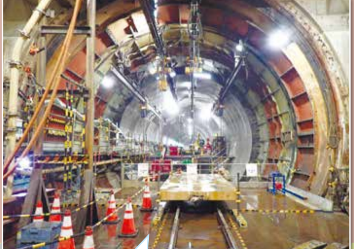
新綱島駅から発進したシールドマシンは新横浜駅に到達し、マシンが解体されてトンネルが繋がった