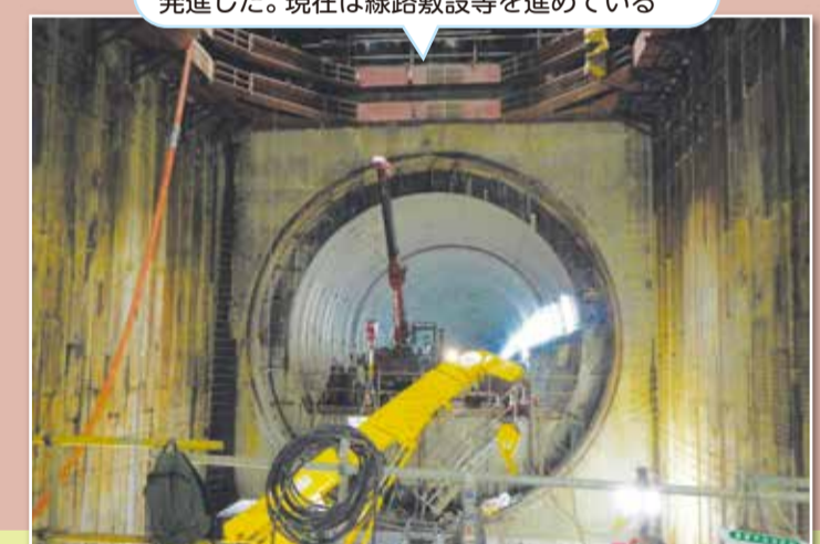
ここから新横浜駅に向けてシールドマシンが発進した。現在は線路敷設等を進めている