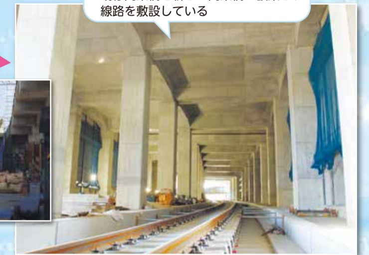
既存高架橋を新しい高架橋に改築し、線路を敷設している