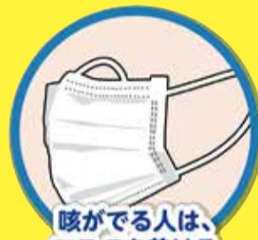
咳がでる人は、マスクを着ける