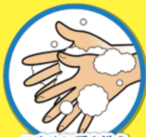
こまめに手を洗う