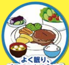
よく眠り、バランスよく食べる

人混みの多い場所は避け、屋内で互いの距離が十分に確保できない状況で一定時間過ごすことは控える