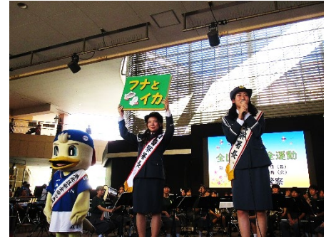
交通安全キャンペーン