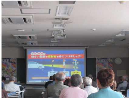
シルバーリーダー連絡協議会総会