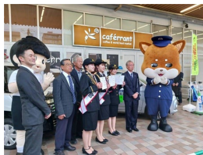
企業防犯協会の防犯キャンペーン