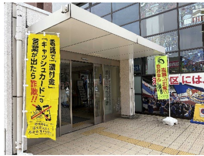
特殊詐欺被害防止キャンペーン