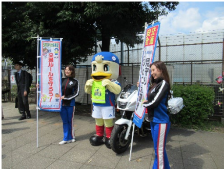
交通安全見守り・ひとこえ運動