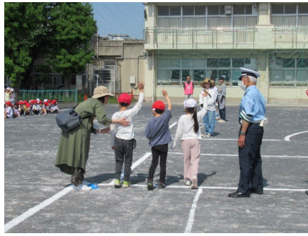
はまっ子交通あんぜん教室