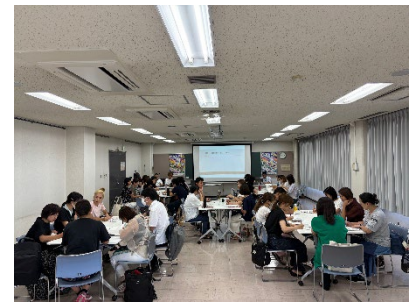
子ども110番の家 ネットワーク会議