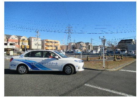
シルバードライビングスクール