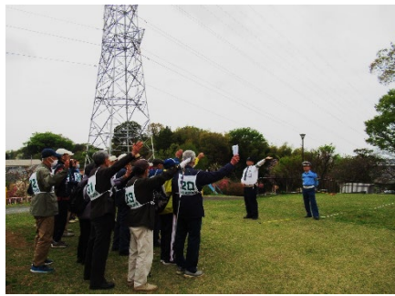
高齢者ウォークラリー