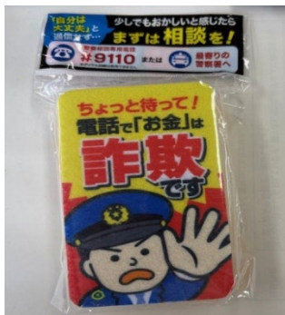
特殊詐欺被害防止啓発グッズ (キッチン スポンジ)