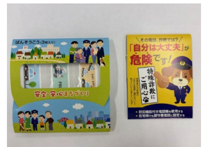
防犯啓発グッズ (ばんそうこう)