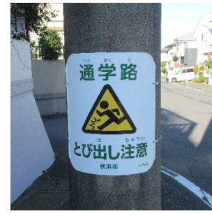
スクールゾーン電柱巻②