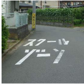
スクールゾーン路面標示