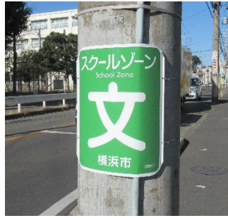
スクールゾーン電柱巻①