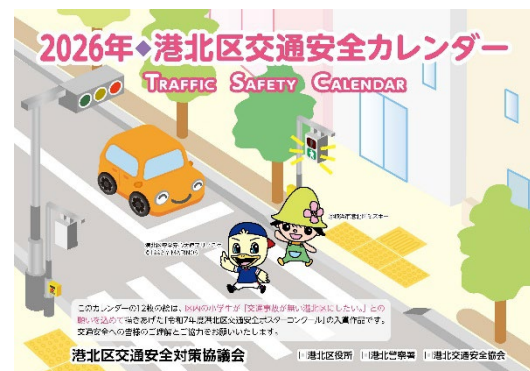
2026年 港北区交通安全カレンダー