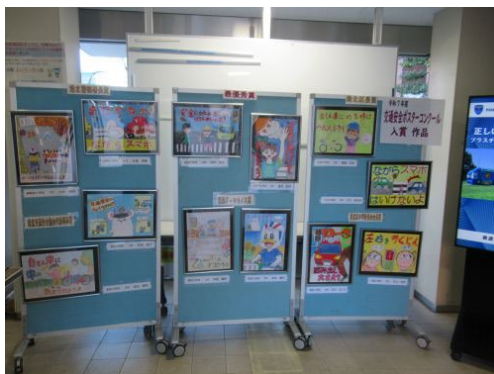
入賞作品の展示（港北区役所）

区内の小学生から交通安全ポスターを募集し、452点の応募がありました。その中の入賞作品12点を「港北区安全・安心のつどい」当日に港北公会堂で展示したほか、12月5日から12月12日までは区役所で展示しました。また、入賞作品を活用した壁掛けカレンダーを作成し、小学校及び保育園・幼稚園、地区センター、ケアプラザ等に配布しました。