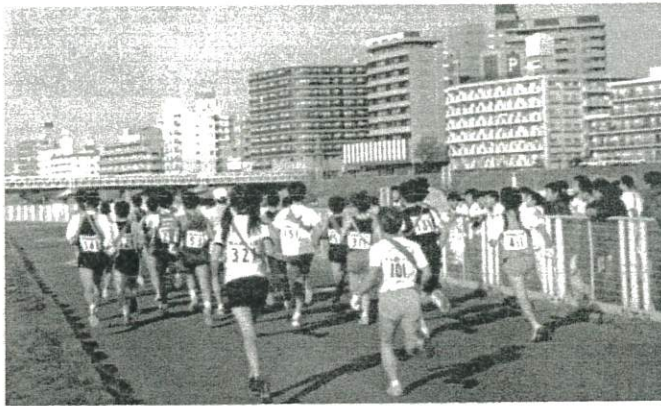
▼いっせいに中継点をめざします

6年女子……中学生になったら大綱中の陸上部に入る。 高校生男子……大学で箱根駅伝を走りたい。 祝勝会最後に連合町会長より、新年に入り最初のイベントに優勝とは幸先のいいスタートとなったとお褒めの言葉を頂きました。選手全員来年もこの気持でがんばろうと約束したところです。選手の皆さんのがんばりに期待しよう!! (太尾地区駅伝チーム監督 野本 征治)