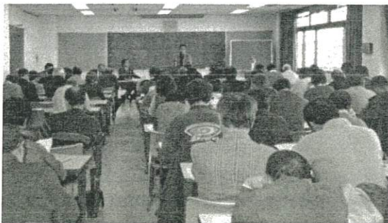
▲各地区の発表を真剣に聴きます