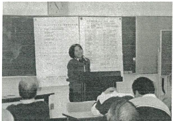
▲OHPや模造紙を使つての発表もありました