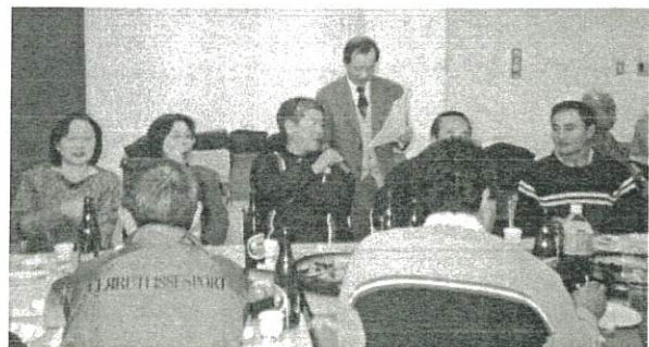
▲懇親会でも発表内容についての質問が飛び出しました