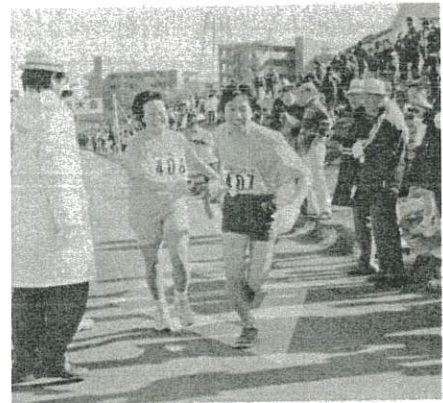
▲「お願い!」「まかせろ!」タスキをつなぎます