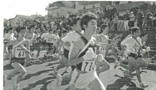
▲大勢の選手が健脚を競いました

築いてこられたこの大会をさらに向上させ、盛り上げていきたいと思えます。最後になりましたが、大会に御協力くださった区役所、港北区陸協の皆様をはじめ、関係者の方々に感謝申し上げます。