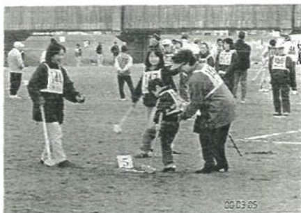
ほらほら、 がんばって…