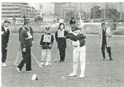
ボールはどこまで 行ったかな？