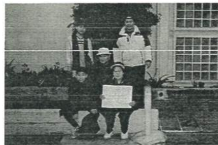
やったね、 チーム優勝！ 城郷Aチームのみなさん