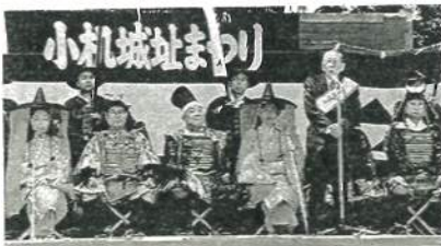
オープニング セレモニー (本丸広場)