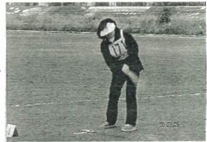
祝・地区優勝！ 綱島地区選手の力強いショット！

今回も本部役員の皆さんには、それぞれの役割分担においてスムーズに運営して頂いたことに対しお礼申し上げます。大会運営全体を通して若干の手直し修正が必要かとは思いますが、多くの地域の皆さんに喜んで頂けたことについては大変良かったと思います。今後とも御理解・御協力をお願い致します。