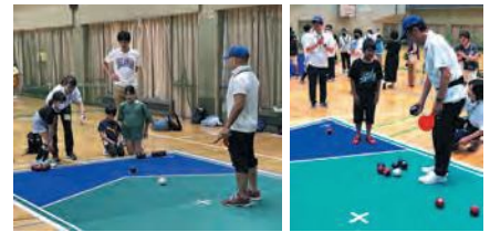
子どもたちにやり方を助言・指導する委員(ポッチャ)

港北区各地区のスポーツ推進委員31名が参加し、安全に配慮し子どもたちにルールを教えたりしながらサポート活動をした。同じゲームに何度も参加する子どもも見られ、スポーツは夢中になって遊ぶのが一番だということを実感した。