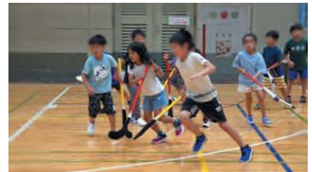
活発に動く子どもたち(ドッジボール・ユニホック)