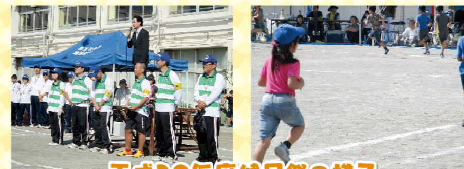
平成29年度健民祭の様子