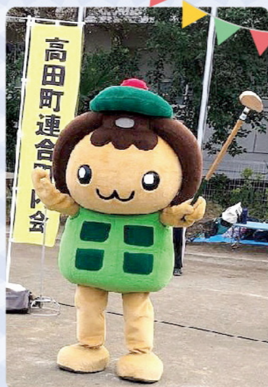
高田地区のユルキャラ たかたん

地域活動には、ペタンク大会、 グラウンドゴルフ大会、ソフトバ レーボール大会、駅伝大会、高田 地区大運動会(残念ながら、近年 はコロナ禍の為開催できませんで した。)などがあります。令和3年 の活動では、コロナ禍を縫って、 ペタンクの实地試験を行い、動画 を作成してみました。これらの地 域活動を通じて、顔の見える関係 づくりに取り組み、誰もが健康で 支え合いのあるまちづくりを目指 しています。