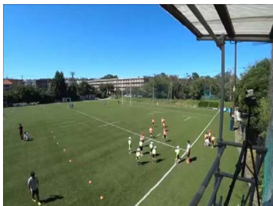
パス&amp;キャッチのお手本映像