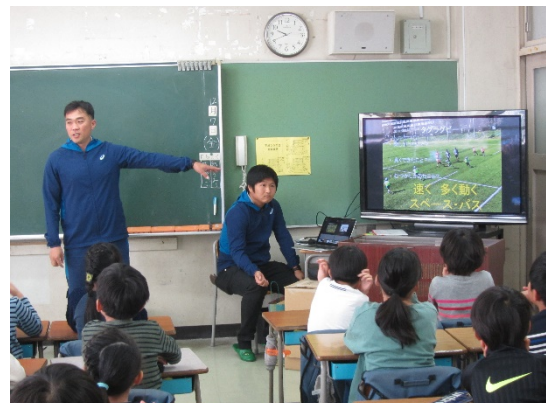
振り返り授業の様子