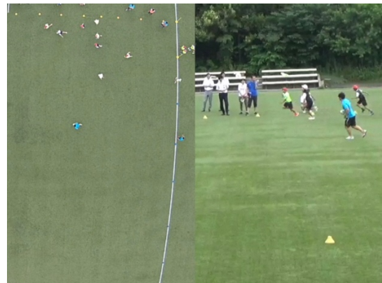
撮影映像(左：ドローン・右：固定カメラ)