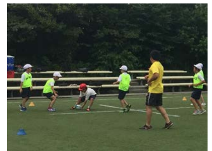
GPS データ取得中の様子