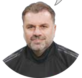
ポストコグラー監督