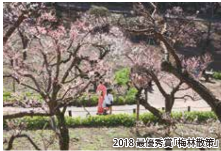
2018最優秀賞「梅林散策」