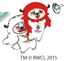
TM © RWCL 2015