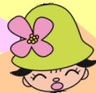
港北区キャラクター「ミズキー」