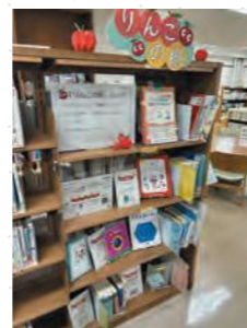
りんごの棚(港北図書館)