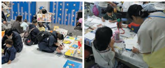
絵本などの展示(横浜アリーナ)