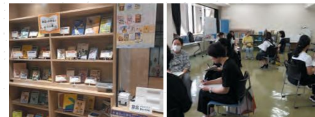
企画展示「港北の小学生がえらぶ本」(日吉の本だな)