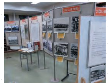
展示「つなしま今昔～網島に温泉があった頃～」(港北図書館)