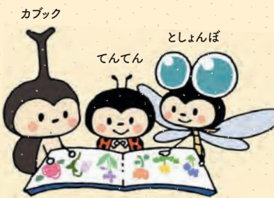
港北図書館キャラクター

横浜市では、乳幼児から高齢者まで全ての横浜市民の読書活動を総合的に推進するため、「横浜市民の読書活動の推進に関する条例」等関係法令に基づき、「第三次横浜市民読書活動推進計画」を令和6年度に策定しました。港北区では、この「第三次横浜市民読書活動推進計画」や、令和2年度に更新した「第二次港北区読書活動推進目標」とその成果等を踏まえ、この度「第三次港北区読書活動推進目標」を策定しました。区内各施設や、関係団体と共に、港北区内の読書活動をより一層推進します。