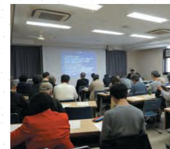
港北区読書講演会(菊名地区センター)