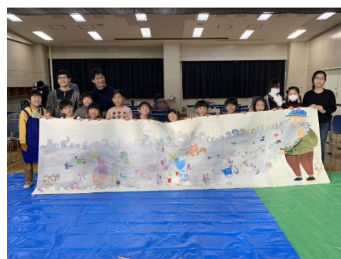
令和5年度港北区読書講演会