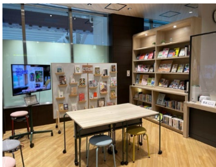
日吉図書取次所(日吉の本だな)