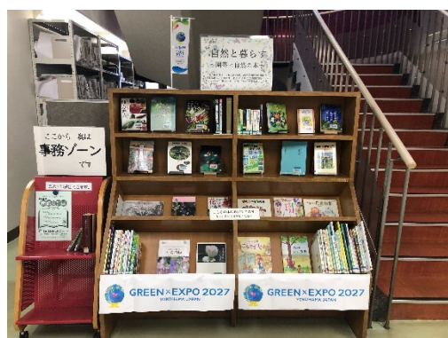
港北図書館での GREEN×EXPO2027 と連携した企画展示