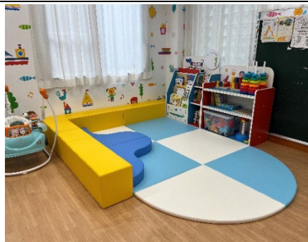
綱島地区センター