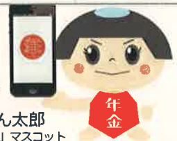
ねんきん太郎 「ねんきんネット」マスコット