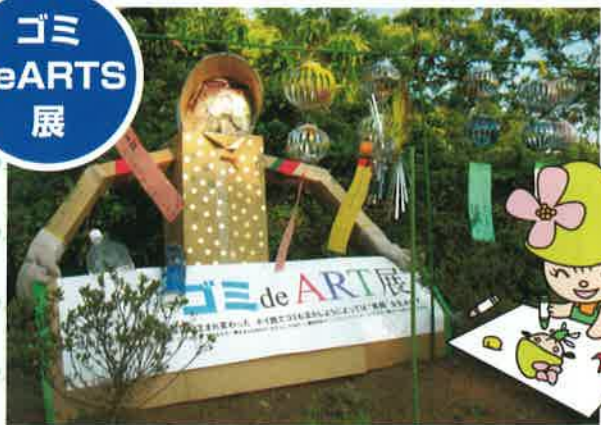
捨てられたアルミ缶やペットボトルを拾い集めて風鈴や風車を製作。子ども達が願いを込めた短冊を吊るした。これら120個程の作品を福島県飯舘村へ届けた。