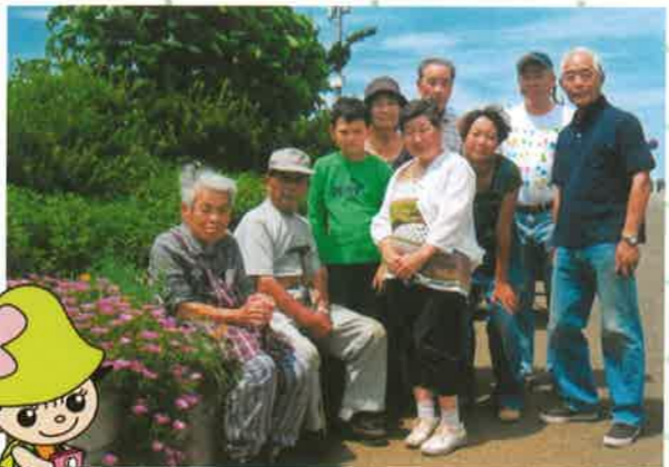
地主さんの協力を得て皆で作業しました。