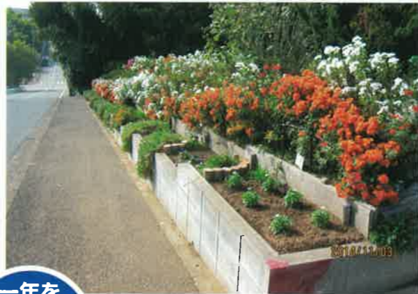
一年を通じて楽しめる花壇群

4月〜5月にかけては芝桜、ツツジ、サツキ、6月にはアジサイが満開になる。さらに11月〜12月には菊が咲き乱れる。