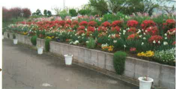
ツツジ、水仙、マリーゴールド、パンジー、金魚草、チューリップ、松葉菊などが次々と咲く。

この花壇を主会場として計4箇所の花壇で「花壇 des ござ ARTS 展」を開催しました。