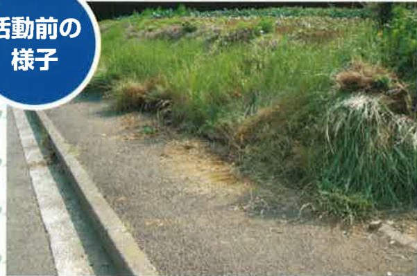
夏の雑草がはびこる通学路。雑草の生える場所は不法投棄が絶えないゴミ捨て場と化していました。