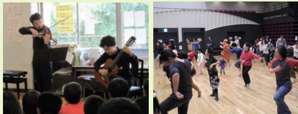
小学校向けアウトリーチ

例：学校・高齢者施設・障害者施設・病院等へのアウトリーチ、芸術文化教育プログラム、ワンコインコンサート、各種ワークショップ、市民参加型の演劇やミュージカル など