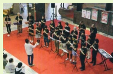
商店街でのコンサート

例：自治会や商店街と連携したまちなかプログラム、港北区内文化施設まち歩きツアー など