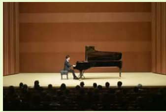
区民文化センター主催公演