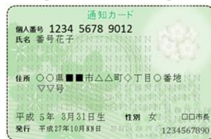
【通知カードのイメージ】