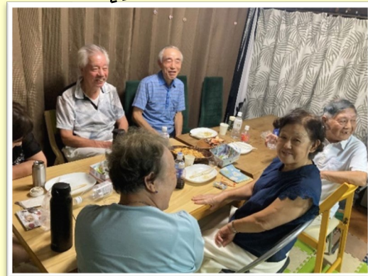
ご飯もおしゃべりも楽しんでいる。