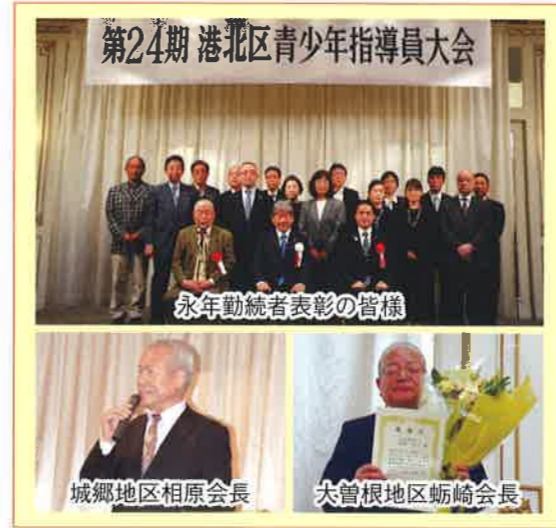
永年勤続者表彰の皆様