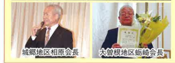
城郷地区相原会長