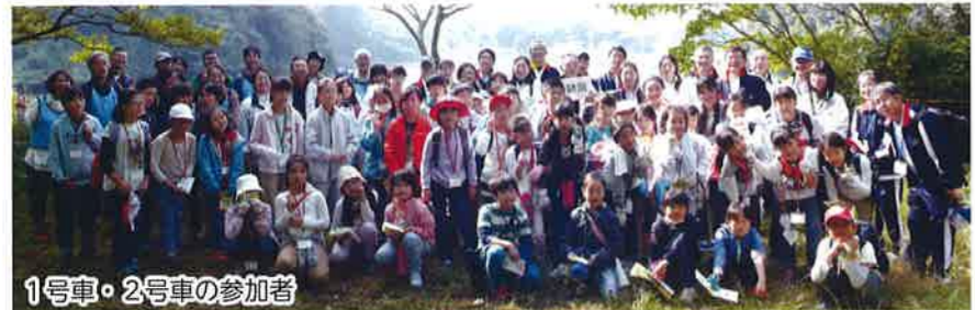
1号車・2号車の参加者

当日は、区役所前広場で開会式を行い、大型バス4台で出発しました。往きの車内では、「小網代の森」の散策について同行していただいたNPO法人小網代野外活動調整会議の説明委員(以下、説明員)から詳しい注意事項がありました。