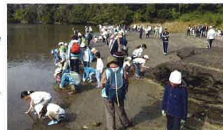
干潟で生き物を探す子どもたち(地図⑤)