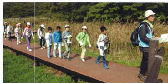
「ガマの穂」の湿地帯(地図④)