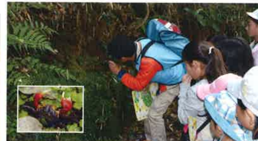
アカテガニのマンション(地図③)