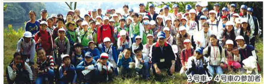
3号車・4号車の参加者