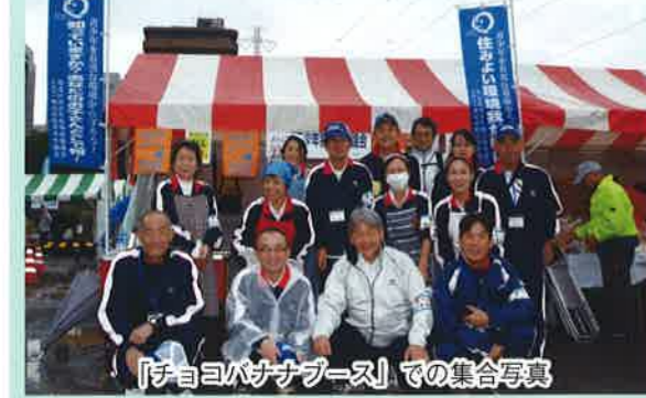
「チョコバナナブース」での集合写真

青少年指導員は昨年に引き続き「わくわく大抽選会」と、ブースでは「チョコバナナ」で参加!「チョコバナナ」は昨年より一味磨きがかかったのですが、悪天候に販売ペースが出遅れたため急きょ会場を巡り販売活動を行い無事「完売」し、来場された皆さんとふれあうことができました。