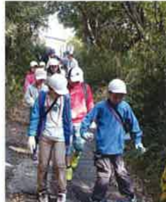
バス下車場所から森へ