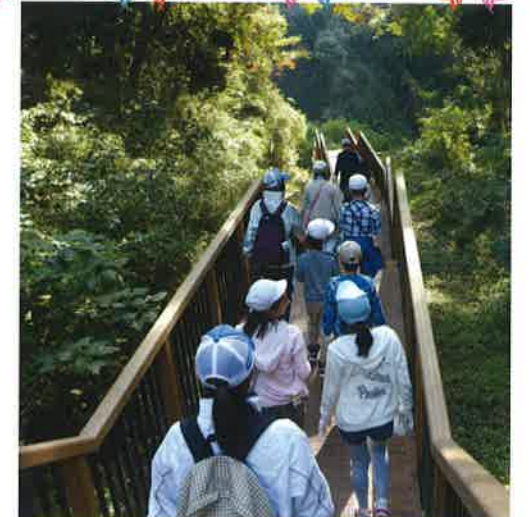
木道を下りて森へ入ります(地図②)