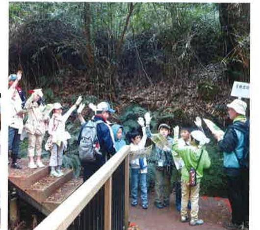
クイズをしながらの散策(地図③)