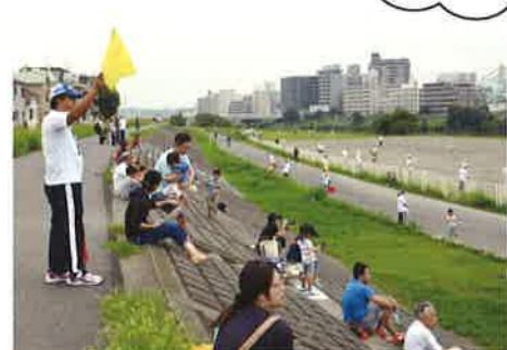
安全確認、オッケー!