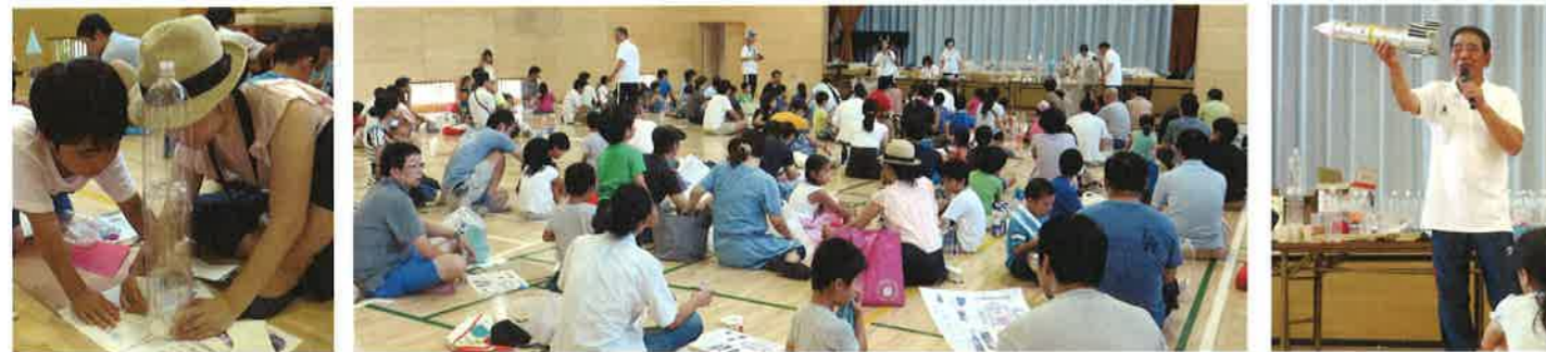
各地区の製作講習会の様子