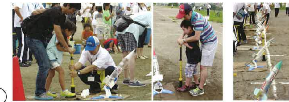
ポンピング30回。結構力がいらいます