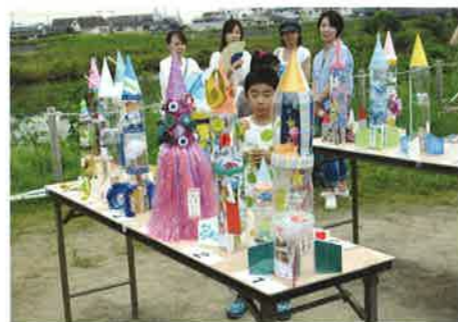
デザイン部門展示コーナー