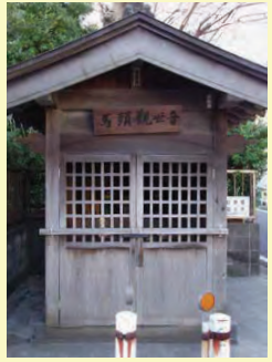
馬頭観音堂 (駒形明神)