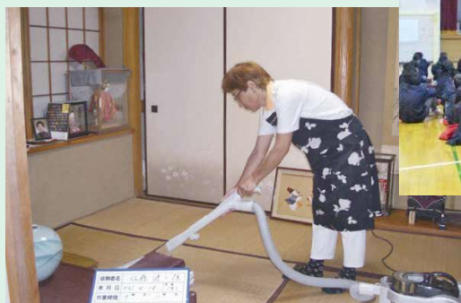
ご近所同士の支えあい 「太尾ふれあいクラブ」