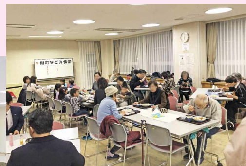
カレーを食べて顔見知り 「樽町なごみ食堂」