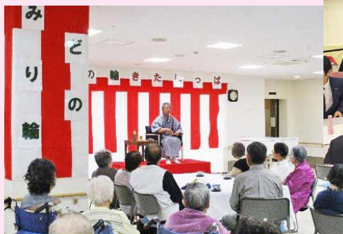
地域と施設・団体が協力した集いの場 「みどりの輪きたにっぱ」