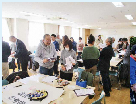
地域や活動団体の繋がりづくり 城郷地区「つながりプロジェクト」