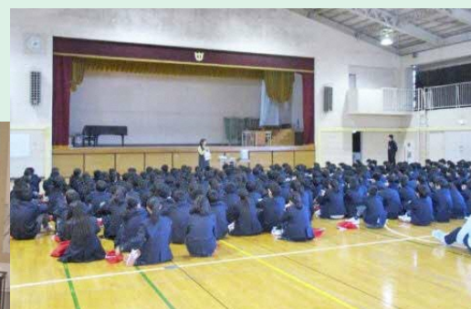
中学生から認知症の理解を 新吉田あすなろ地区 「認知症サポーター養成講座」