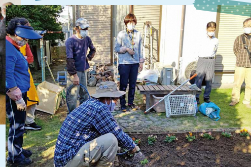
子どもも大人もつながる居場所 「高田コミュニティカフェゆずの樹」