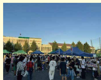
あすなるふれあい夏まつり