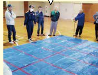
【地域防災拠点訓練】