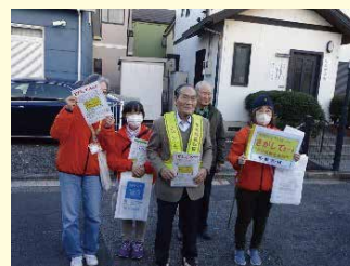
さがしてネット模擬訓練