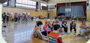
わあいわあい広場