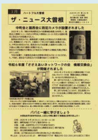
『ザ・ニュース大曽根』 毎月回覧板でお届け

ハートフル大曽根ホームページ一部リニューアル まちの情報・イベントのお知らせや報告を配信中。 『ハートフル大曽根』で検索!