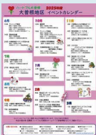
『イベントカレンダー』 毎年6月ごろ 各家庭に配布