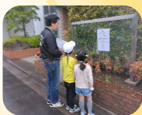
3部会でクイズラリーの開催