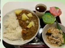
毎月28日は新羽のみんなで