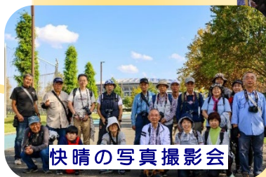
快晴の写真撮影会