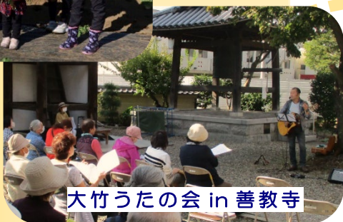
大竹うたの会 in 善教寺