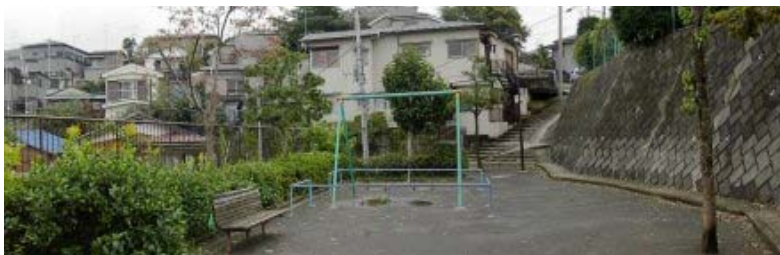
傾斜地の公園（篠原町会下谷第二公園）

住民を年齢別にみると、25歳から40歳までが大きな山を、次いで45歳から60歳までが小山をなしており、高齢化率は19.3%で区平均と比べると若干高い程度に見えますが、絶対数は多く、1人住まい、2人住まいの高齢者が多くなっています。高齢者は、将来さらに増える見込みです。