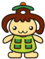
高田地区キャラクター 「たかたん」