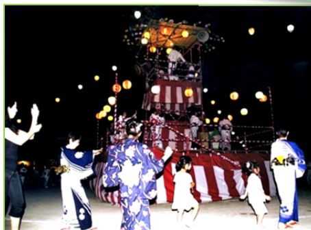
納涼福祉盆踊り大会