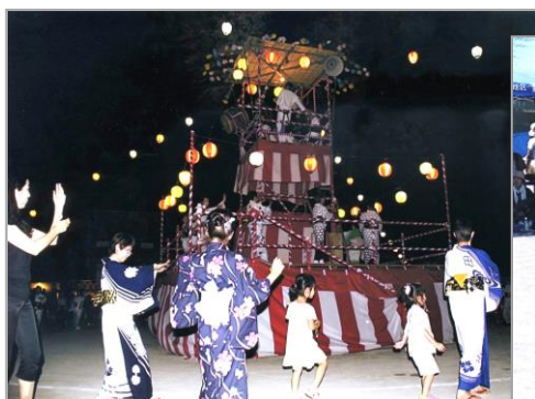
盆踊り大会の様子