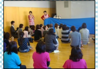
<子育てサロン「らっこ」>