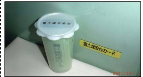
＜安心カードと訓練の様子＞

篠原台町自治会 で「無事を知らせるマグネットシート」の配布、 菊名南町自治会 では「菊名南ささえ隊」の結成とボトルセットの配布、併せてささえ隊員ボランティアの募集拡大等に取り組みました。また、 篠原東自治会 も準備を進めています。日頃から顔の見える関係をつくっていくことが災害時に生きると思っています。