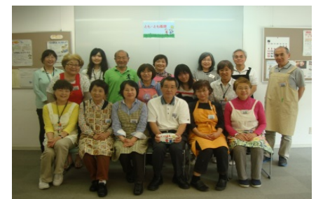
<ボランティアのみなさん>