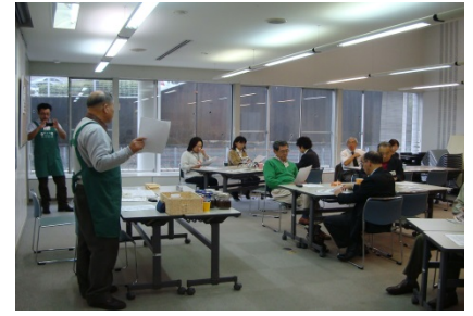
＜住民向け講座の様子＞

男性ボランティア発掘のため「男のコーヒー淹れ方」講座を実施し、ご夫婦も含む参加者の方々に活動団体の紹介等をし、 ボランティアの裾野を広げる活動 をしています。