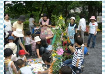
<公園遊び・サロン「しのはらランド」>