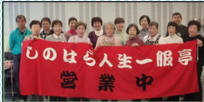
<しのはら人生一服亭>