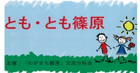
<とも・とも篠原のロゴマーク>

平成24年度から進めてきた障がい児放課後余暇支援事業の名称を「とも・とも篠原」に決め、昨年度は年5回活動を行いました。ボランティアを募集し、毎回15名程の方が活動してくれました。参加された児童の保護者からは「活動が楽しいと自宅でも話している」、「少人数の中でコミュニケーションを取り合い、交流する機会となった。」との声をいただいています。今年度は6月から年6回開催予定です。