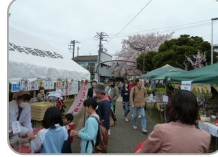
太尾堤緑道の模擬店