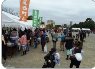
公園内模擬店風景