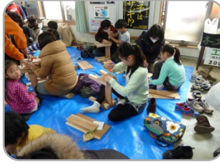
子ども 踏み台作り