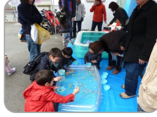
スパーボールすくい