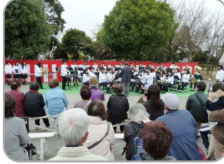
港北高校吹奏学部