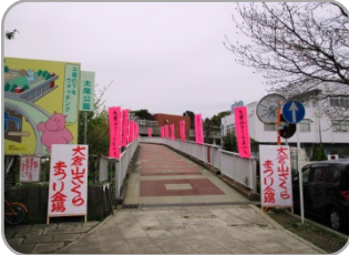
さくらまつり会場入口