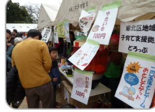
どろっぷコーナー