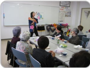
「お茶とお話しの会」 年2回、