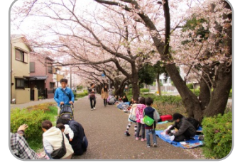
太尾堤緑道フリーマーケット