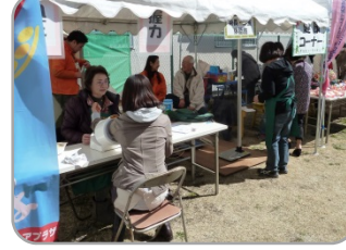
健康チェックコーナー