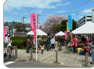
太尾堤緑道(土木事務所前)