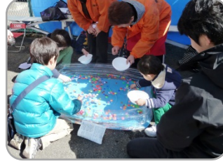
スパーボールすくい