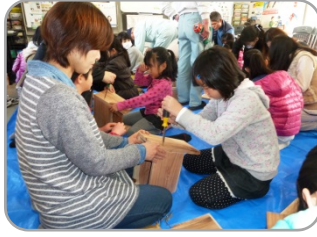
子ども 踏み台作り