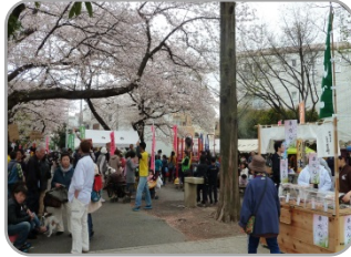
広場(太尾小交差点側)