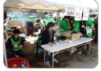
焼き芋&ヨーヨー釣り